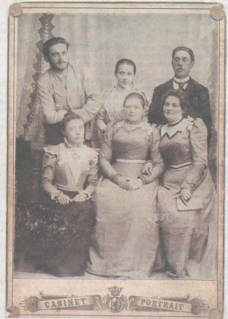
Волошинівська жіноча гімназія, 1907 р.