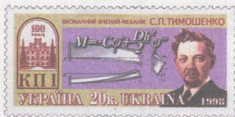
Марка з його портретом