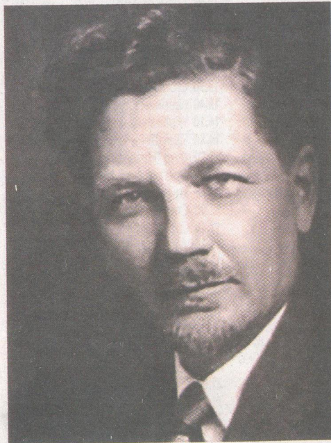
Фото Степана Прокоповича

Про дитячі роки С.П.Тимошенко докладно розповідає у своїх спогадах. З них варто згадати прикметну деталь: зимовими вечорами, коли батько майбутнього вченого був вільним від господарських турбот, мати читала йому вголос вірші Шевченка.