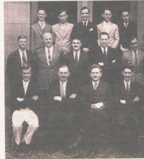
Степан Тимошенко (сидить другий праворуч) серед викладачів Мічиганського університету

Восени 1918 року він був призначений одним з 12 академіків Української Академії наук та очолив організований ним Інститут технічної механіки (тепер Інститут механіки ім.С.П.Тимошенка). Проте в умовах бурхливих подій в Україні, коли змінювалися уряди й режими, а в Києві велися військові дії, його діяльність на посадах професора політехнічного інституту, академіка і директора інституту механіки не могла тривати довго. У вересні 1919 року Київ був за-