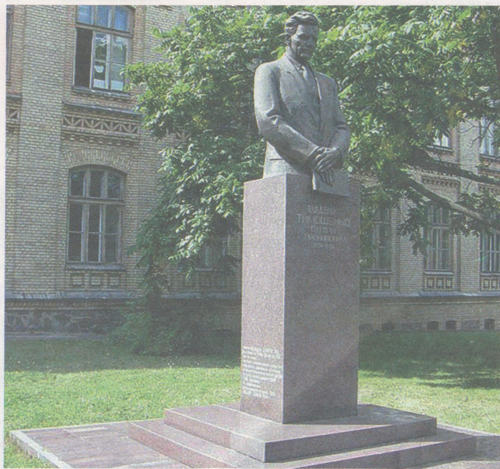
Пам'ятник у Києві