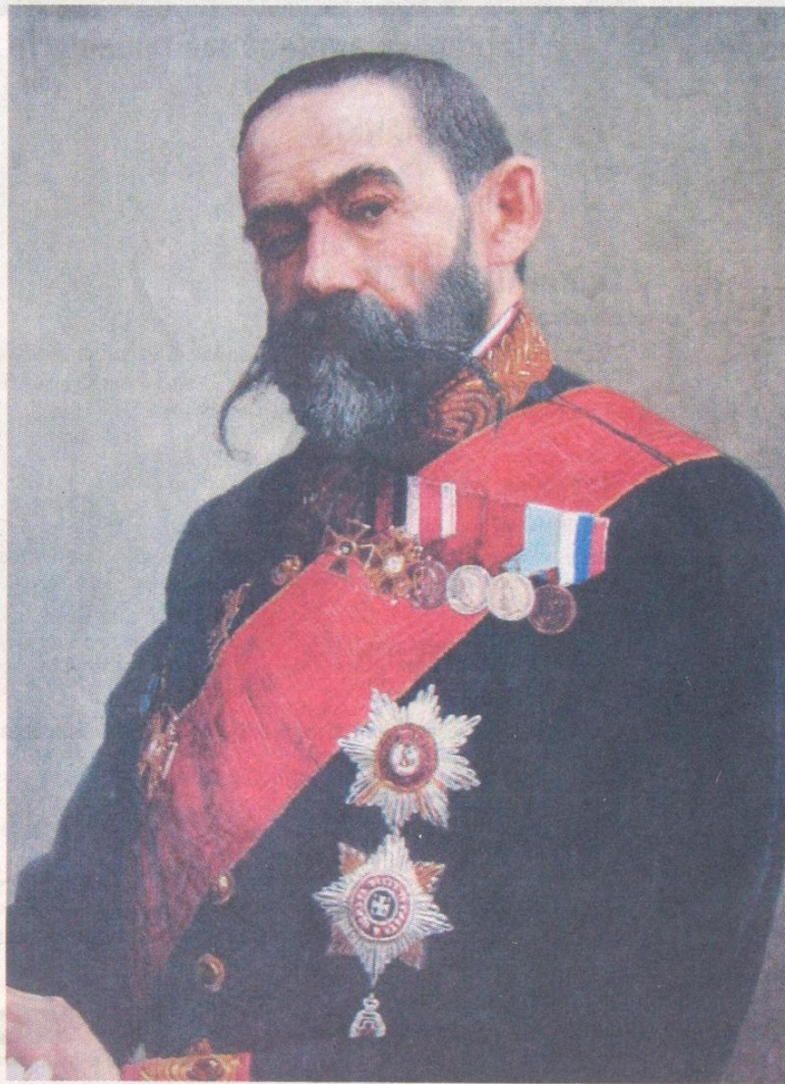
ПОСЛЕДНИЙ КАПНИСТ. Последний из рода, несколько поколений которого увлеченно собирали произведения искусства. Портрет работы Ивана Святенко

В первом зале выставлены образцы иконописи того же времени. Самая интересная икона — Архангел Михаил. Архангел огромного роста, при мече, как и полагается предводителю воинства. А лицом напоминает первого российского императора Петра I. Те же усики, те же щеки, даже прическа похожа. Бывал данный государь в Лебедине в то время, когда «шведы воевали», вот и осталась