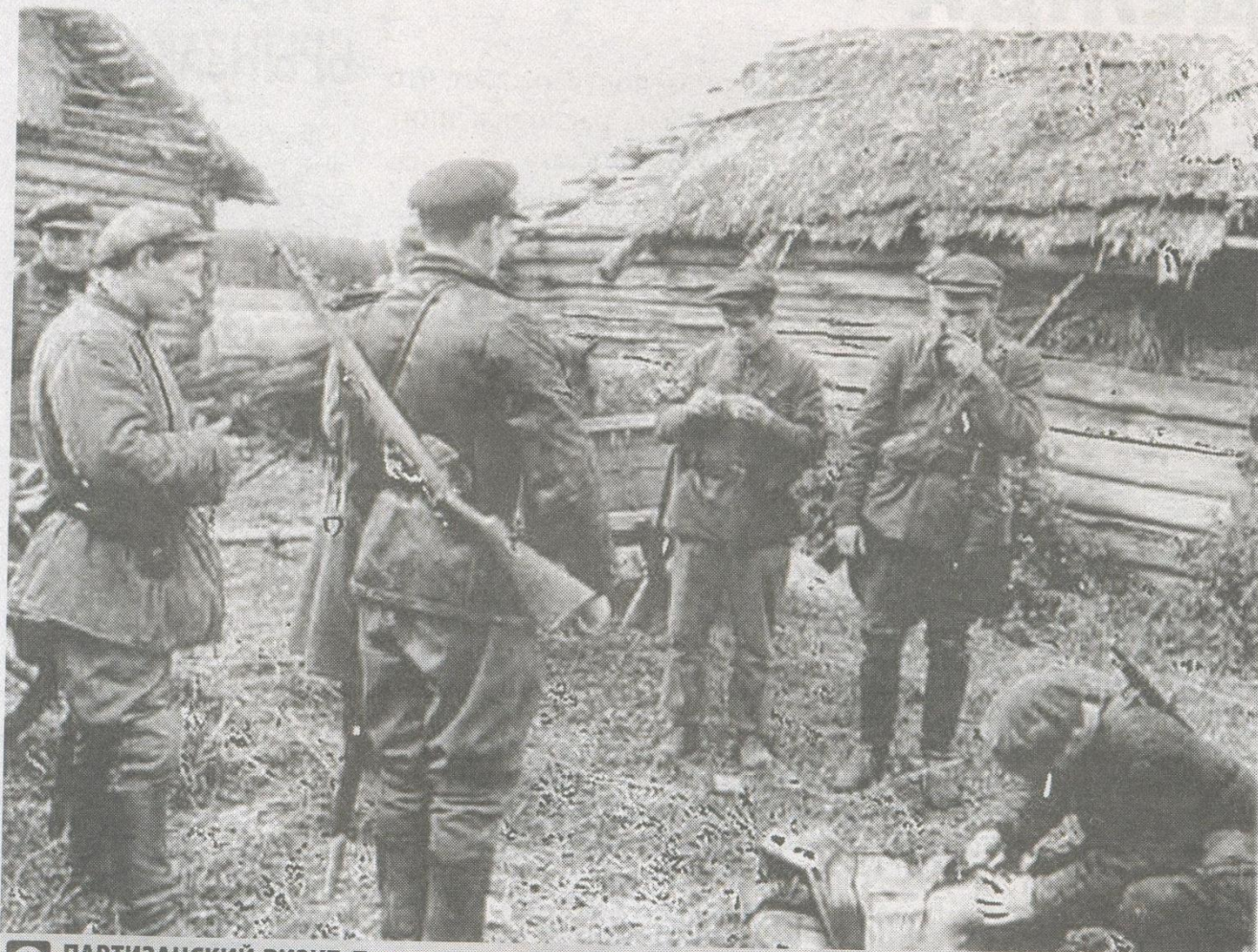
ПАРТИЗАНСКИЙ ВИЗИТ. Пишут, что партизаны снабжались централизованно, через большую сеть секретных аэродромов. Но без местного населения они бы не выжили

глядел. Но во дворе бегали наши куры, так они кур забрали и пошли дальше. Не сообразили, что, где куры, там и люди. Так мы и спаслись».