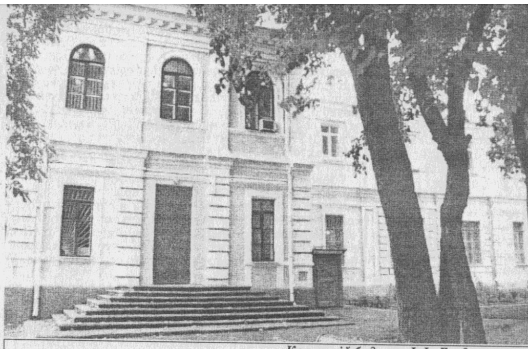
Колишній будинок І.Ф. Богдановича

віддалених місць»; сумські ярмарки називалися «збірними» на відміну від тих, які мали значення суто місцевого. В Сумах процвітало ремісництво і діяли вже два чималі підприємства мануфактурного типу: шкіряний завод (щороку виробляв близько семи тисяч шкір різних сортів) та завод миловарний, який випускав щороку майже тисячу пудів мила.