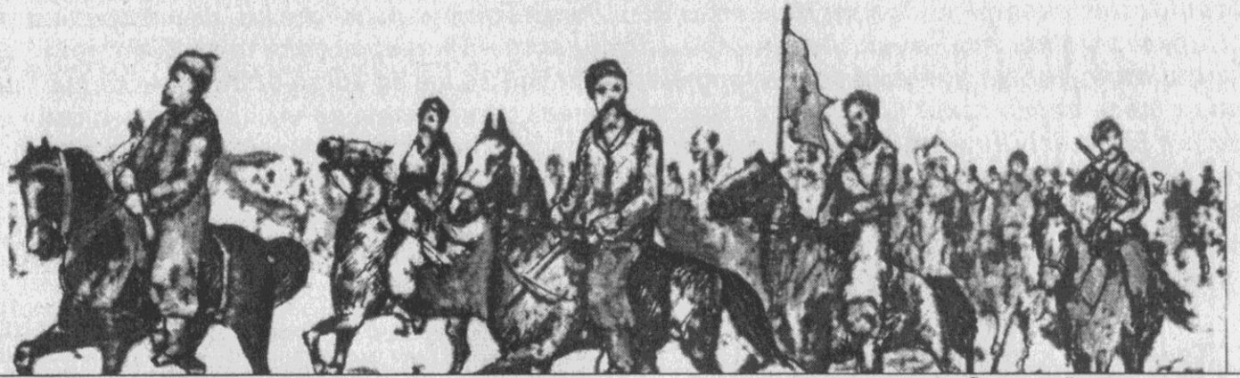
Сумський полк на марші

Масове переселення до Дикого поля, до цієї, за Д. Багалієм, споконвічної української землі, почалося жителями Правобережжя під час Визвольної війни під проводом Б. Хмельницького після поразки українських військ під Берестечком (1651). Так, у своєму відомому літописі Р. Ракушка-Романовський відзначає, що Б.Хмельницький, чекаючи зручного часу для помсти, «дозволив поневоленому ляхами народу переселитися до кордонів Москви», і що «з того часу почали осідати Суми, Лебедин, Харків, Охтирка та інші слобідські міста аж до Дону козацьким народом». Про це свідчить і літопис Григорія Грабянки. Хмельницький не лише дав такий дозвіл, а й допоміг переселенцям зброєю, кіннями,