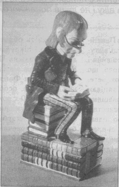
Чорнильниця «Бібліофіл» з колекції Гансена

Після встановлення радянської влади садиба Сумовських двічі націоналізувалася і двічі поверталася Олені Августівні владними органами УНР та військовою адміністрацією армії А. Денікіна відповідно.