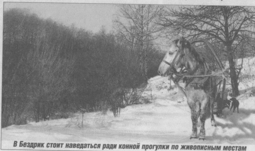
В Бездрике стоит наведаться ради конной прогулки по живописным местам

После революции 1917 года в Бездрике не осталось ничего, что напоминало бы об Алферовых. Дом разрушили, тополиную аллею, которая вела к храму Архангела Михаила, вырубали, 200-летний архив династии выволокли в террасный сад и сожгли. Вместе с садом. С