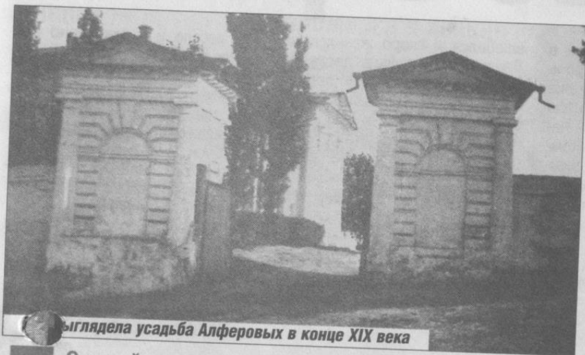
Выглядела усадьба Алферовых в конце XIX века

С этого живописного места и пошел славный казацкий род Алферовых