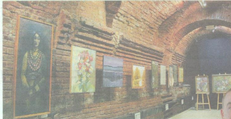
Галерея у підвалі храму

Однією із більш ніж вікових споруд міста Суми, окрасою вулиці Троїцької є Костел Благівіщення Пресвятої Діви Марії. Осередок католицької віри сьогодні став місцем зустрічі творчих людей, краєзнавців, культурним центром міста. Важко повірити, що колись у костелі розташовувався спортивний зал, а на території храму в Будинку Парафіяльному була комуналка.