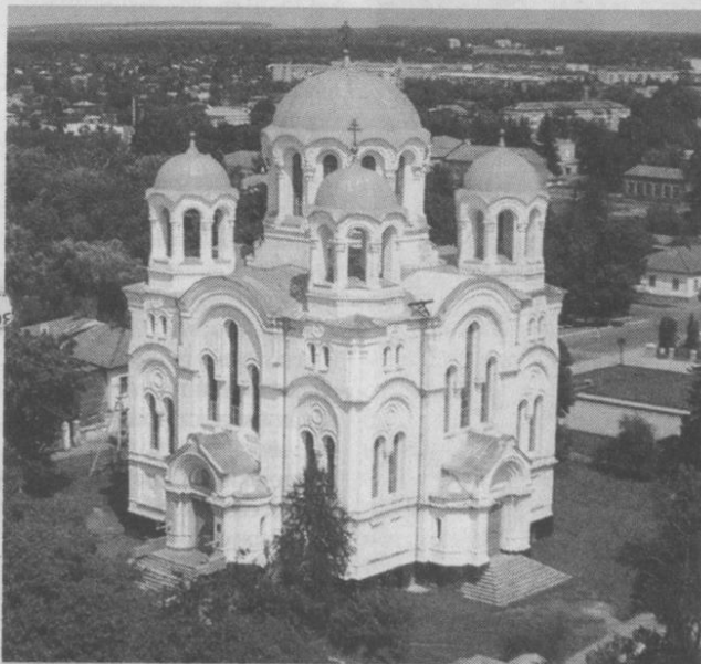
УКРАИНСКОЕ БАРОККО. Храм в Глухове, который просто красив снаружи и изнутри. Его сравнивают с более известными, но именно эта церковь является фамильным храмом и усыпальницей семьи Терещенко