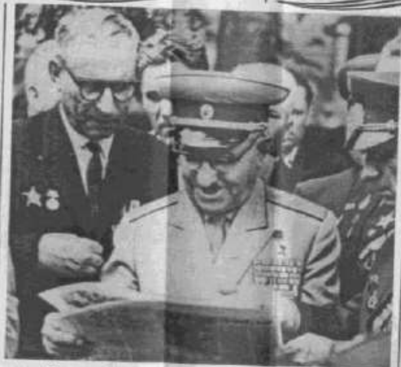
Генерал-лейтенант С.С. Мартиросян в гостях у сумчан