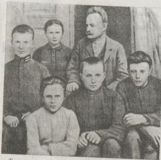
Франко з дружиною Ольгою Федорівною, дочкою Ганною, синами Андрієм, Тарасом, Петром

Після смерті Івана Франка життя у його родині погіршилося. Ольга Федорівна постійно лікувалася, через те, що багато друзів