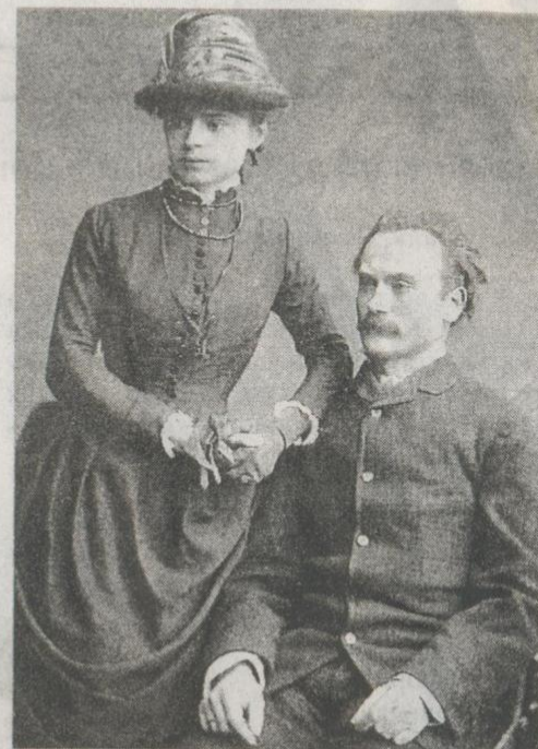
Іван Франко і Ольга Хоружинська. 1886 р.

У Тимофіївці вже ніхто не повертається, адже старші діти навчалися, а над меншими оформлять опікуєство. На військову службу пішов один із братів Микола. Під час російсько-турецької війни він був тяжко поранений, і велінням випадку біля його смертного ложа опинився цар. Той саме обходив військові шпиталі, де лежали поранені. Самодержавець зупинився й біля офіцера Хоружинського, якому необхідна була ампутація ніг, та той від неї відмовився, мовляв, який служивий без ніг. Цар, вражений герої-