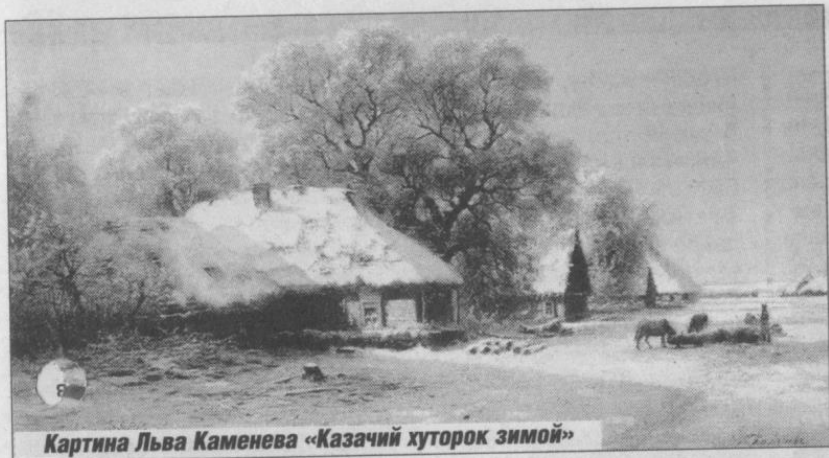
Картина Льва Каменева «Казачий хуторок зимой»

Почему село Верхняя Сыроватка раньше называлось Злодеевкой?