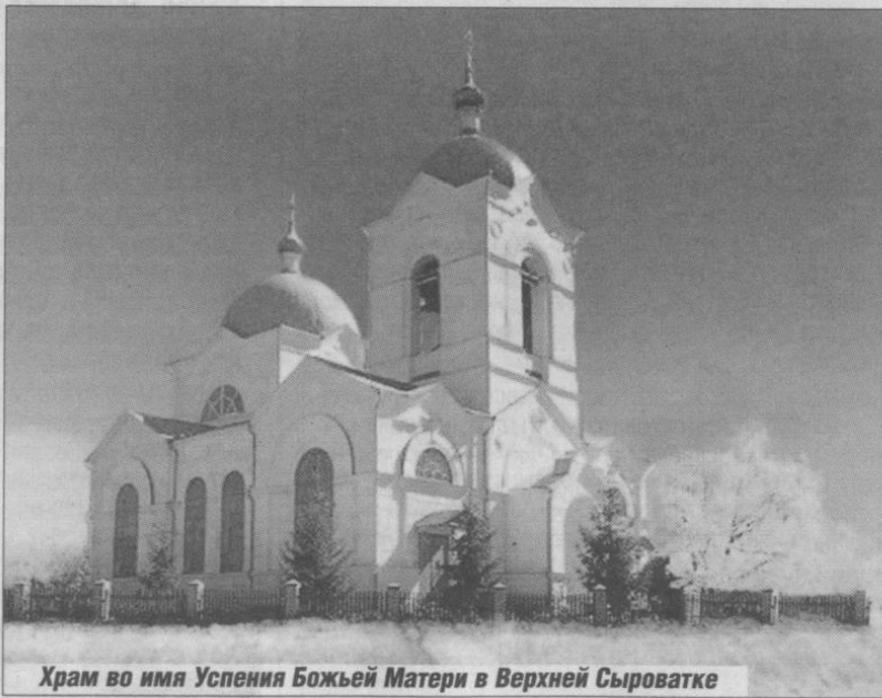
Храм во имя Успения Божьей Матери в Верхней Сыроватке