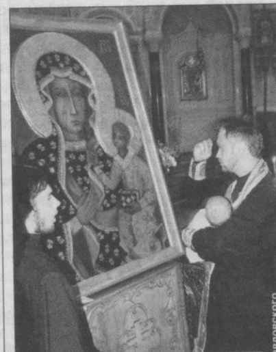
Ченстоховская икона Божьей Матери в сумском Спасо-Преображенском соборе