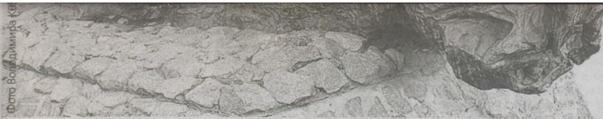
Скульптурна композиція «Партизанський рейд», встановлена в Сумах на Покровській площі

скульптури на європейському континенті».