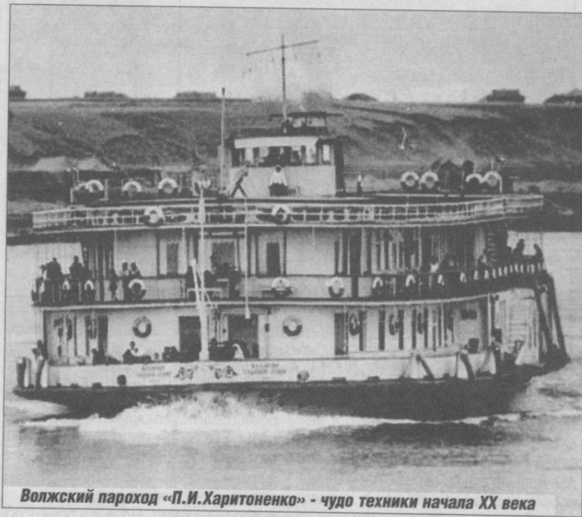
Волжский пароход «П.И.Харитоненко» - чудо техники начала XX века

ви исправно вызванивали благовест молодоженам. Подрастали дети, выходили в люди. Да в какие люди!