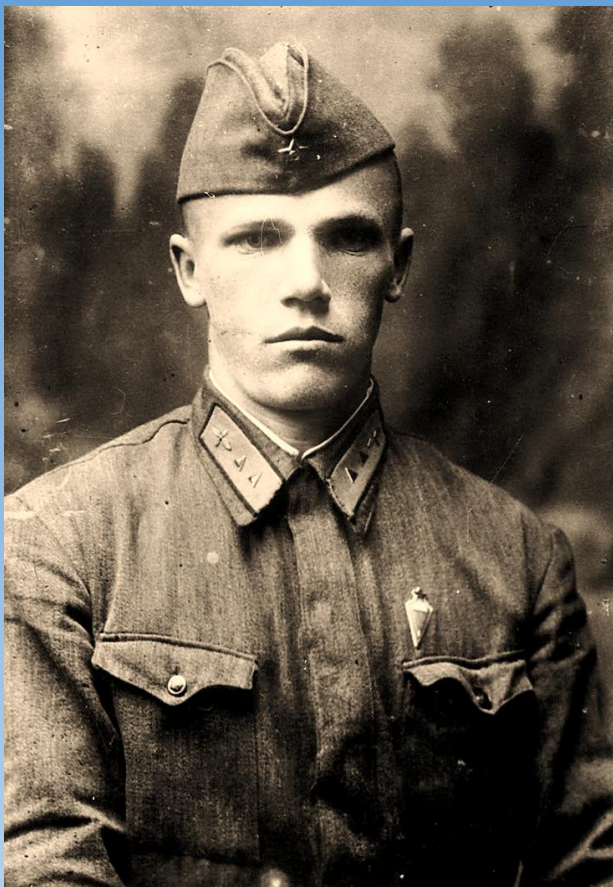
Сержант Іван Кожедуб, 1941 р.

З початком німецько-радянської війни разом з авіашколою евакуйований до Казахстану у м. Чимкент. Після багаточисленних прохань відправити на фронт, його бажання задовольнили у 1943 р. Іван Кожедуб проходив службу у 240 полку винищувачів 302 авіаційній дивізії, яка була розташована в Іваново.