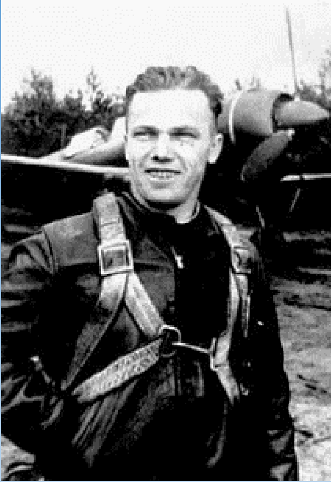
Іван Кожедуб курсант Чугуївського льотного училища

Іван Микитович Кожедуб – вважається найкращим асом серед військових льотчиків СРСР та льотчиків антигітлерівської коаліції часів Другої світової війни.