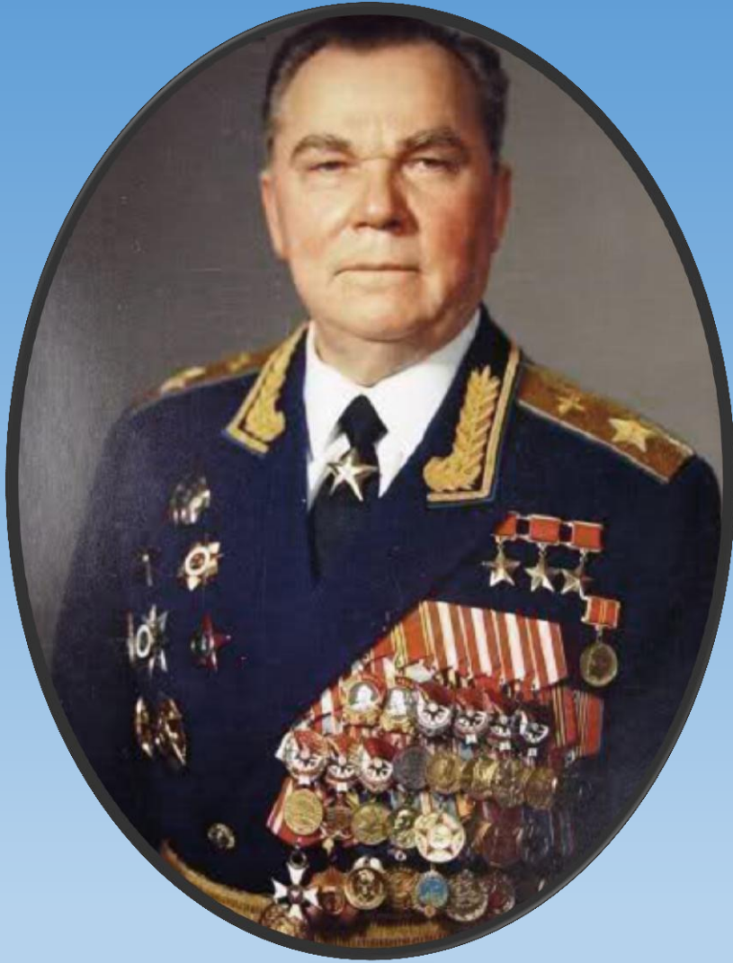
Маршал авіації І. М. Кожедуб. 1985–1989 рр.

Після війни Іван Кожедуб працював на посадах у Військово-повітряних силах СРСР. У 1950-1953 роках командував авіаційною дивізією, яка воювала у Північній Кореї.