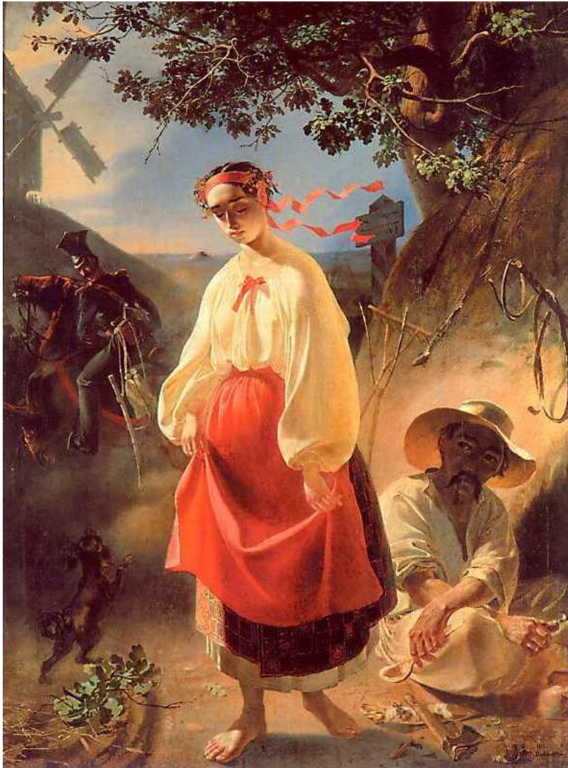
Т. Шевченко. Катерина. 1842

поемою тему і побудований відповідно до специфіки образотворчого мистецтва.