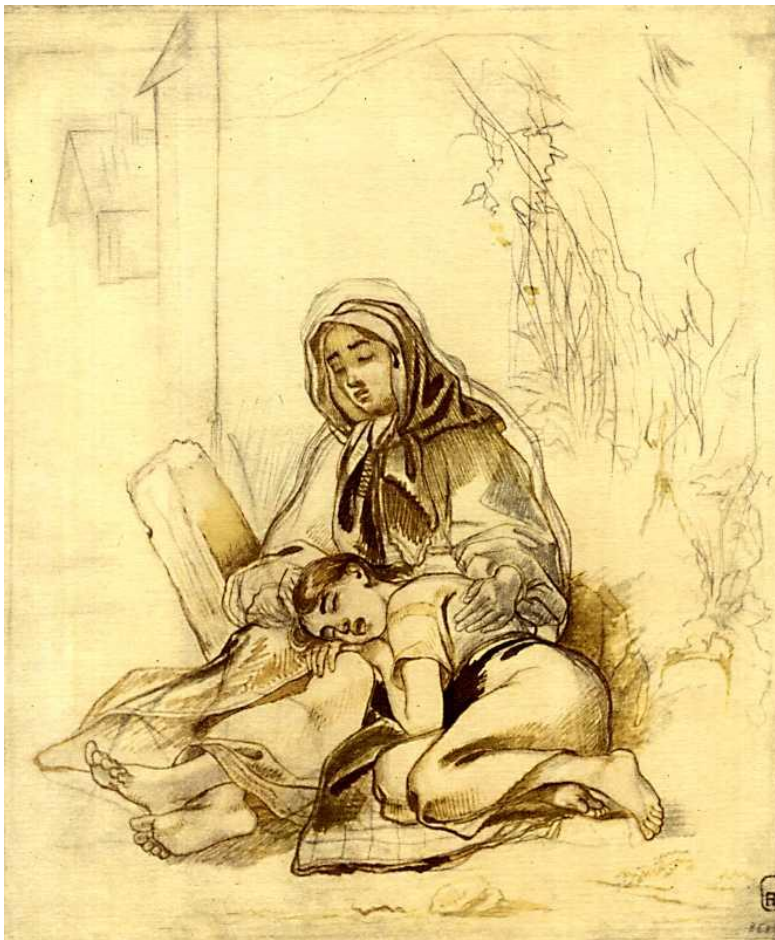
Т. Шевченко. Слепа з дочкою. За мотивами поеми «Слепая». 1842

затіненій частині картини. Порівняно з величною постаттю Катерини він виглядає мізерним, іграшковим. Холодний, зеленкувато-синій тон підсилює трагедію дівчини-покритки, її сумний настрій. Впадає в око і співчутливий погляд діда. Відірвана гілка символізує скалічене молоде життя. Прагнучи до посилення емоційного звучання твору, автор поетизує героїню, свідомо прикрашаючи її. На дівчині святковий одяг: біла з довгими пишними рукавами сорочка, барвиста плахта, червоний фартух, з прикрашеної вінком голівки спадають, розвиваючись на вітрі, довгі червоні стрічки. Шевченко творив свою картину далеко від рідної України, тому не мав змоги малювати з натури. Але національний український одяг дівчини, характерний краєвид надають картині виразного національного колориту.