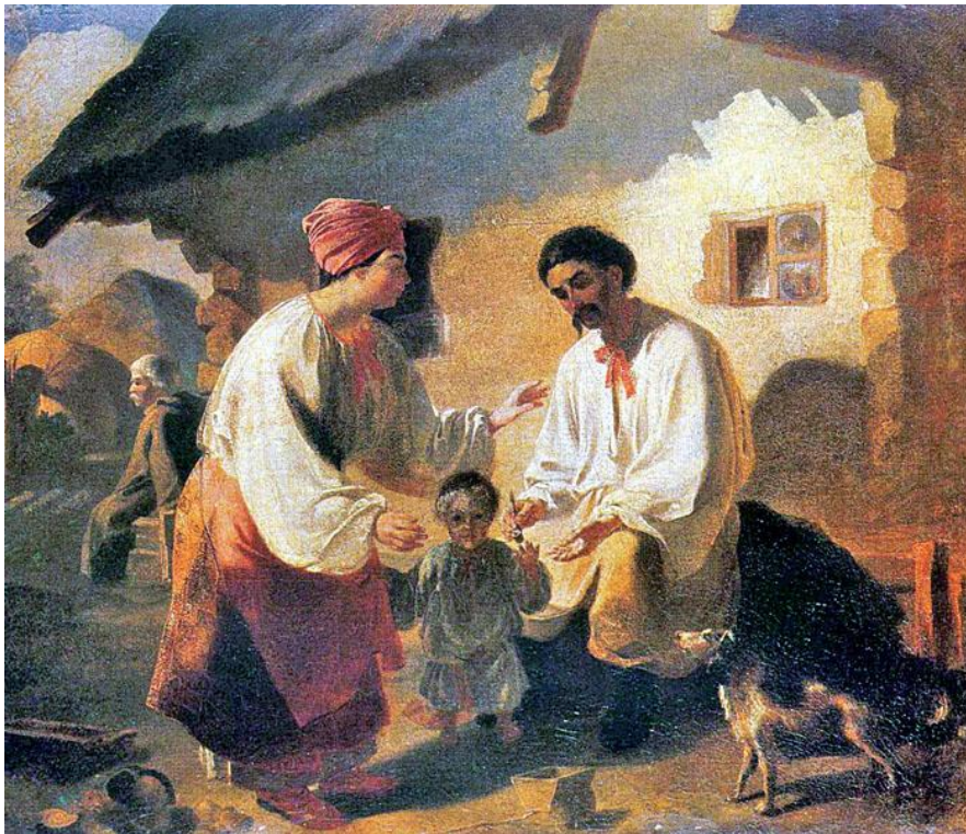
Т. Шевченко. Селянська сім'я. 1843

«Селянська сім'я» (1843, олія). До Шевченка-художника приходять відчуття сонця, світла, повітря, чого бракувало в академічній майстерні. Йому вдалося тепер вже олійними фарбами передати рух життя. Якби не